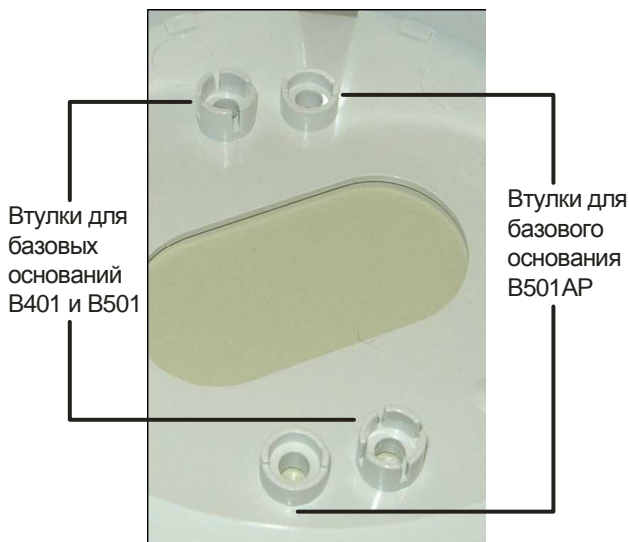
Рис. 1. Установка базового основания извещателя в RMK400AP